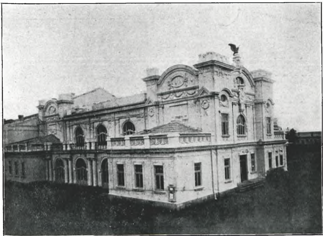
Fot. 1. Gmach Sokola.