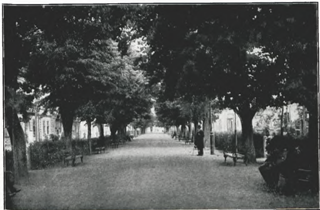
Fot. 2. Aleja Kolejowa.