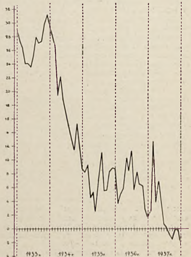
Średnia miesięczna stanu zadłużenia P. P. T. T. w P. K. O. w milionach złotych.

Z kredytu tego przedsiębiorstwo zmuszone jest korzystać z powodu braku kapitału obrotowego.