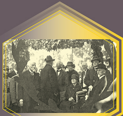
Polożenie kamienia węgielnego pod budowę Instytutu Radowego z udziałem Marii Skłodowskiej-Curie, 1925 r.