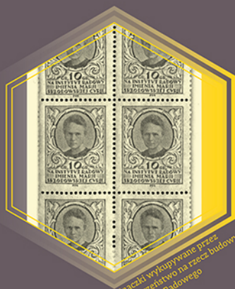
Znaki pocztowe wydane przez społeczeństwo na rzecz budowy Instytutu Radowego

F. Curie, Maria Curie: biografia Projekt ten był dla niej niezwykle ważny. Zaangażowała się w planowanie budowy i pracowała w zarządzie Towarzystwa Instytutu Radowego, a także w Komitecie Daru Narodowego dla Marii Skłodowskiej-Curie, który gromadził środki finansowe na budowę Instytutu.