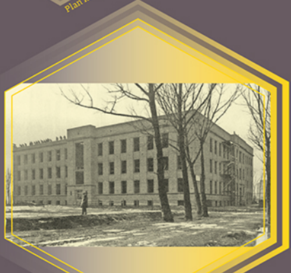
Budowa gmachu klinicznego Instytutu Radowego przy ul. Wawelskiej, 1927 r.