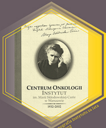
Monografia Instytutu za lata 1932-2002