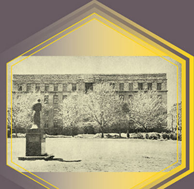
Pawilon Instytutu Radowego z pomnikiem Marii Curie na pierwszym planie

1923 Komitet daru Narodowego im. M. Skłodowskiej-Curie w celu zbudowania Instytutu Radowego w Warszawie