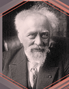
Jean Perrin (1870-1942), francuski fizyk, przyjaciel Marii i Piotra