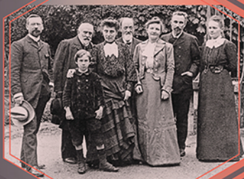
Maria i Piotr Curie z przyjaciółmi naukowcami w ogrodzie