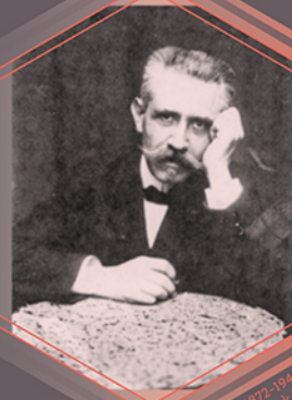
Paul Langevin (1872-1946), przyjaciel Marii, fizyk i pedagog, wynalazca hydrobalczarza ultrafioletowego