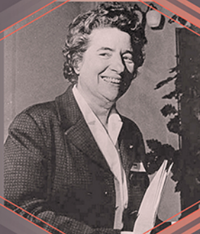
Marguerite Perey (1909-1973), osobista asystentka Marii w laboratorium we francuskim Instytucie Radowym