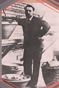
André-Louis Debierne (1874-1949), wybitny i współpracownik Marii Skłodowskiej-Curie