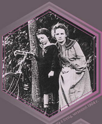
Maria z Ireną, wrzesień 1904 r.

Kaczorowska T. córka mazurek-błędów Evwy (1906), młodszej córki Marii, nie ciekawi chemia ani fizyka. Ma zainteresowania humanistyczne, jest pisarką i pianistką. Wstawia się napisaniem poczytnej biografii o matce. [...] Obie córki były kochane i obdarzane przez matkę ciepłem i przyjaźnią.