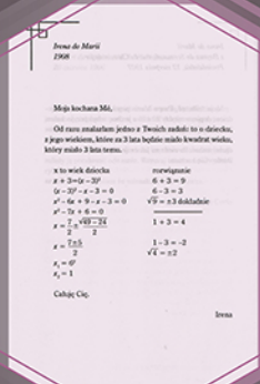
List Ireny do Marii, 1908 r.