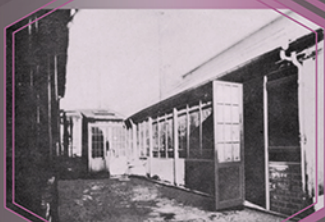
Skrynia zropa przy Rue Lhomond, miejsce odkrycia polonu i radu

Najpiękniejszym odkryciem Piotra Curie jest Maria Skłodowska-Curie. Jej największym odkryciem jest promieniotwórczość Frederick Soddy brytyjski chemik, laureat Nagrody Nobla z 1921 r.