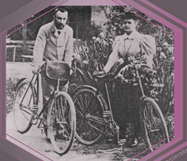
Państwo Curie wyruszają na wycieczkę rowerową z ogrodu przy domu na Boulevarde Kellermann