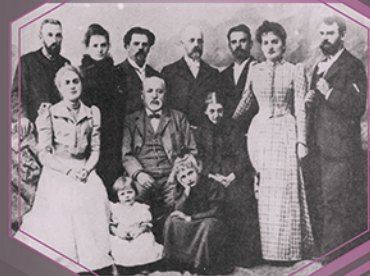
Jedyną walcówkę spędzoną wspólnie z Piotrem Curie i rodziną w Polsce, Zakopanem, 1899 r.

Jedną z naszych rozrywek w owym czasie to przychodzenie do pracowni wieczorem. Dostrzegaliśmy wtedy ze wszystkich stron słabo mieniące się zarysy szkieleń i torebek, w których mieściły się nasze preparaty. Ze wszystkich stron witały nas błęde, rozproszone światelka, jakby zawieszone w ciemnościach. [...] Żarzące się rurki wyglądały jak nikłe, czarodziejskie światelka [...].