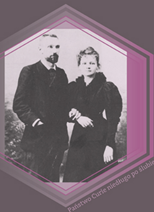
Państwo Curie niedługo po ślubie