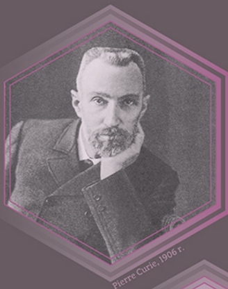
Pierre Curie, 1906 r.