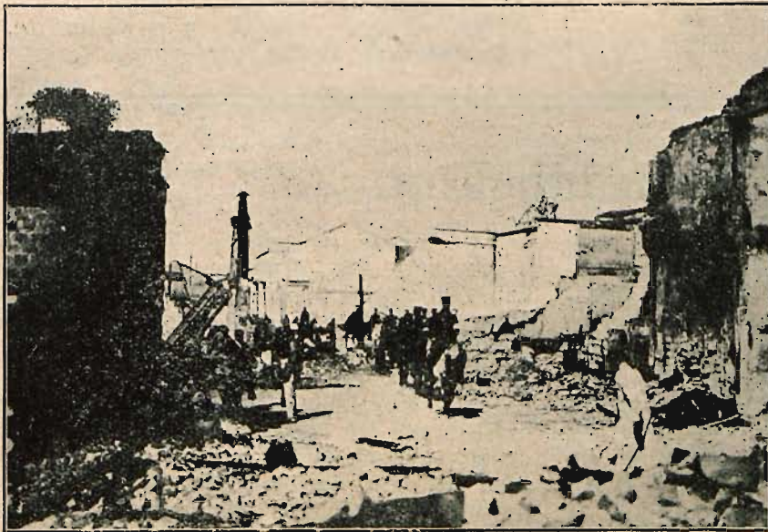
Przedmieście Nankinu po zajęciu przez armję południową.

Świat budzących się Chin jest tak od nas oddalony, a jednakowoż tak wybitnie wpływa na całokształt obecnych zarządzeń, że warto o nim coś niecoś wiedzieć, tych kilka słów