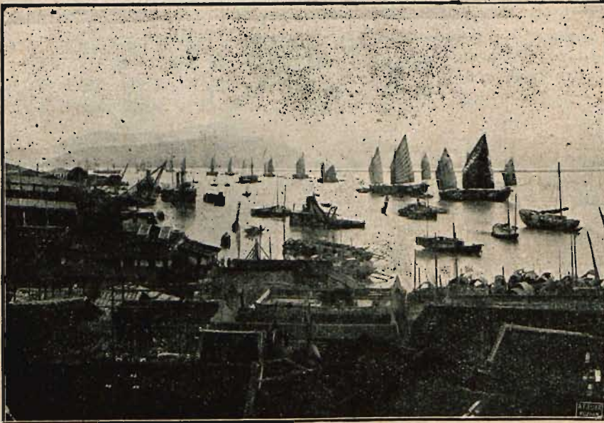
Chińskie miasto Nankin nad rzekę Jan-Tse-Kiang. Wielki rzeczny port koncentrujący znaczną część eksportu z Chin.

położone nad rzeką Jang-Tse-Kiang. Tam, zaraz po pierwszym locie, wykonał jego obserwator zdjęcie portu. Dokonał go, gdy powracali na lotnisko, fotografując z małej wysokości. Jest to raczej szkic panoramowy,