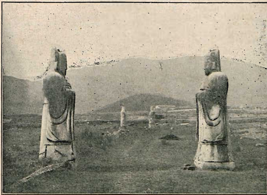
...na lotnisku za miastem, w pobliżu grobów dynastji Nankingów...

jedwab, porcelanę i inne wyroby. Tu, w Nankinie, jest jakby stacja przeładowcza, skąd dżonkami idzie towar w dół rzeki, której szerokość w tej miejscowości wynosi około