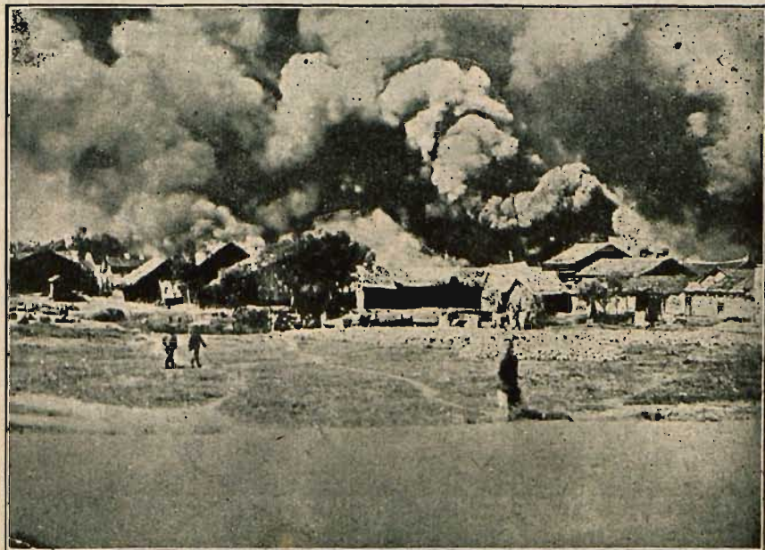
Płonąca po ataku lotniczym miejscowość Chin — Kiang.

tuje się handel prowincji Chin Środkowych. Przez miasto przechodzi szlak karawan, które ciągną z głębi Azji, przynosząc cenny chiński