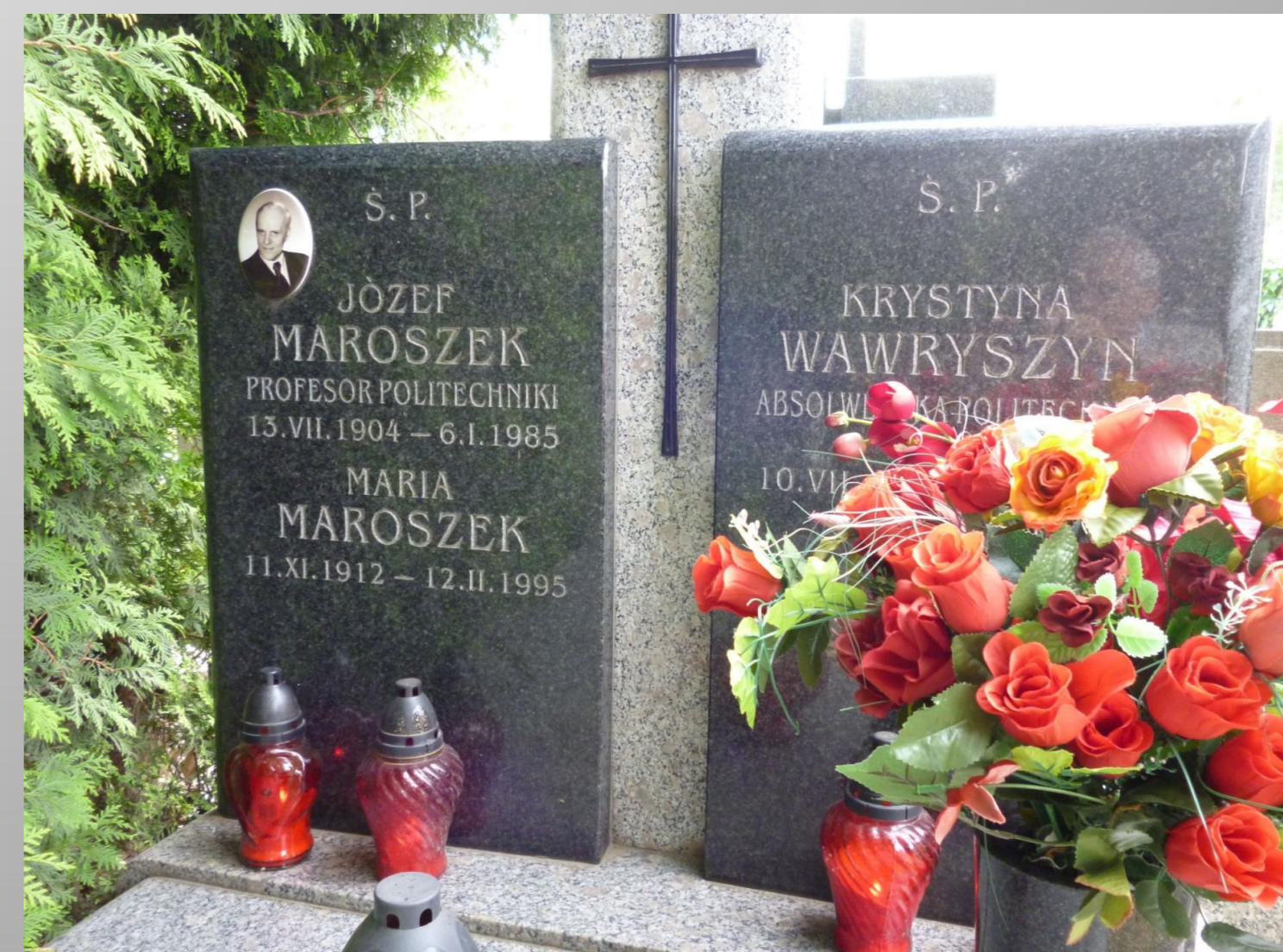
Płyta nagrobna – cmentarz Wawrzyszewski, kwatera 11C-V-43