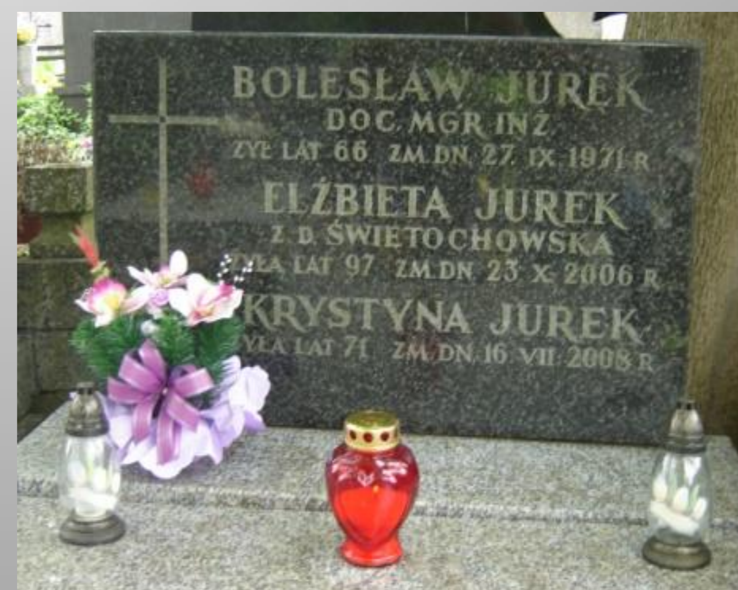
Płyta nagrobna – cm. Bródnowski, kwatery 33-I-III-7