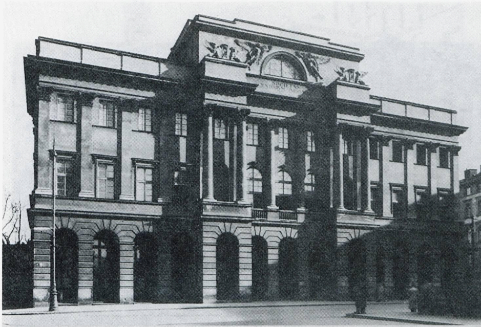
Ryc. 8. Warszawa. Gmach Towarzystwa Przyjaciół Nauk, Pałac Staszica. Fasada po częściowej rekonstrukcji Mariana Lalewicza w latach 1924–1926. Fot. H. Poddębski 1927 r., neg IS PAN, nr 2475