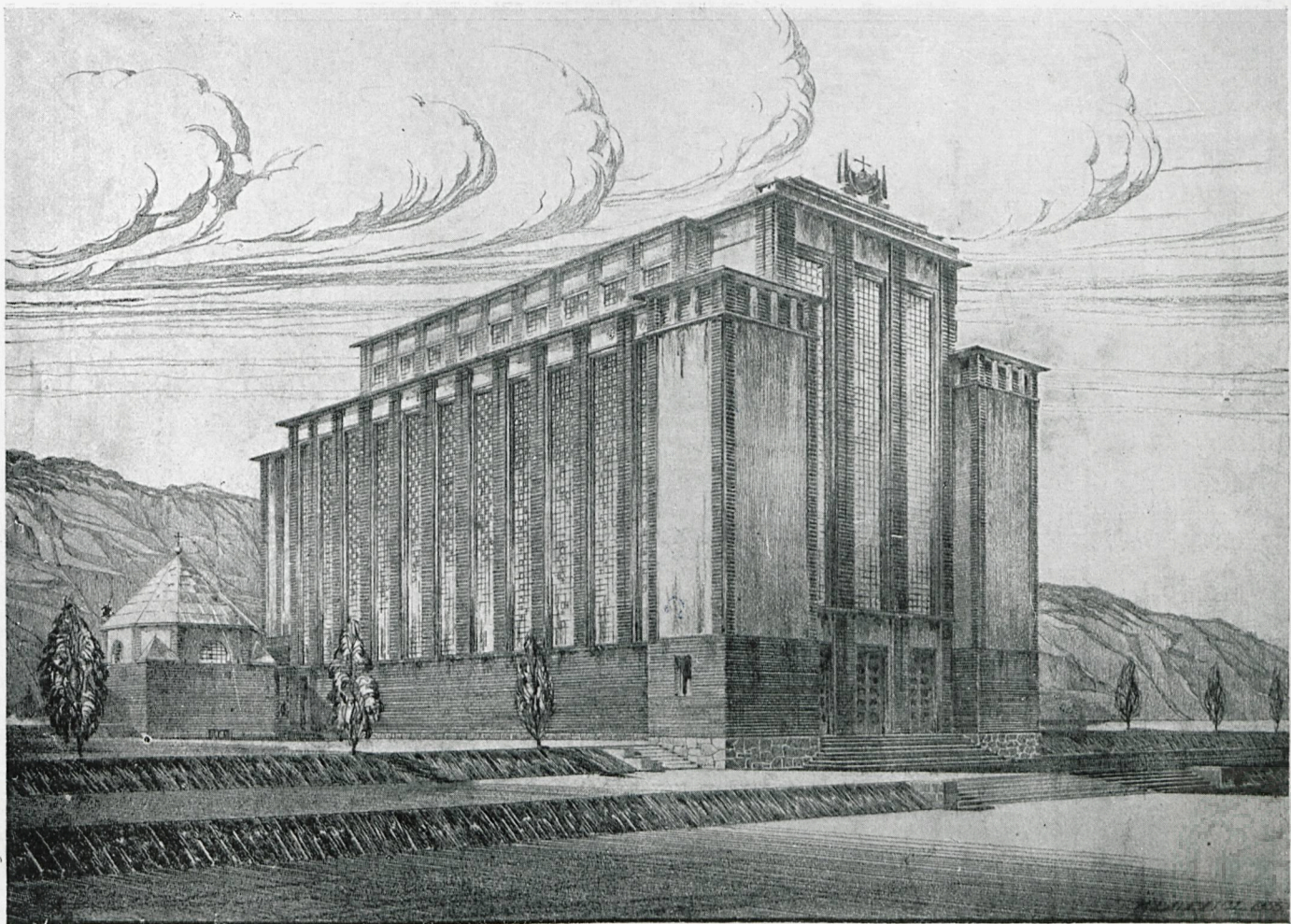
Przekrój i plan w skali 1:400.