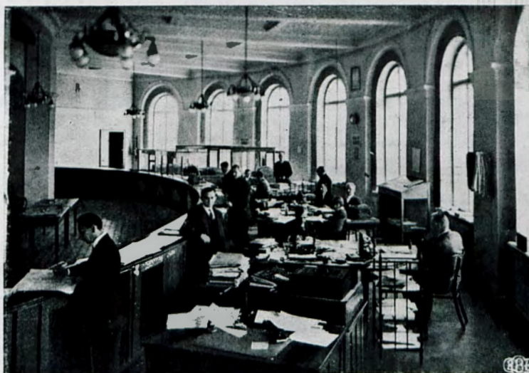
Budowę wyk. f. „S. Pronaszko i R. Sobieszek” (W-wa). Instalacje wodne, oczyszczania ścieków i ogrzew. centraln. wyk. f. „Instalator” (W-wa). Skarbiec i rob. ornam. wyk. f. „G. Gottschalk”, rob. malarskie wyk. f. „T. Jamiołkowski i S. Jarzęcki” (W-wa).