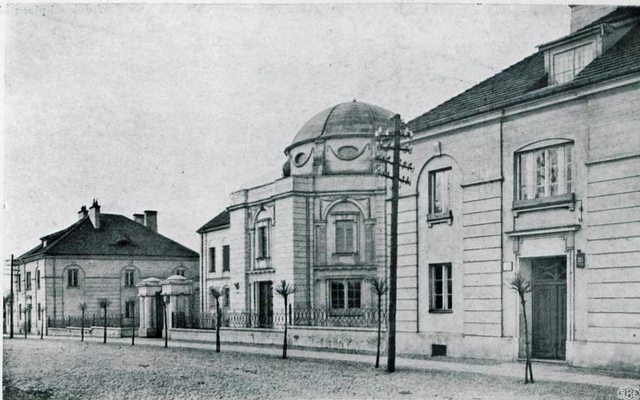
Widok od ulicy.