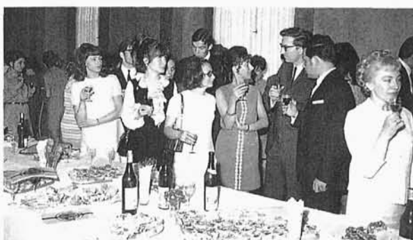
25. Autor (w okularach) rozmawia na spotkaniu z pracownikami ośrodka ZETO-ZOWAR w 1970 r.