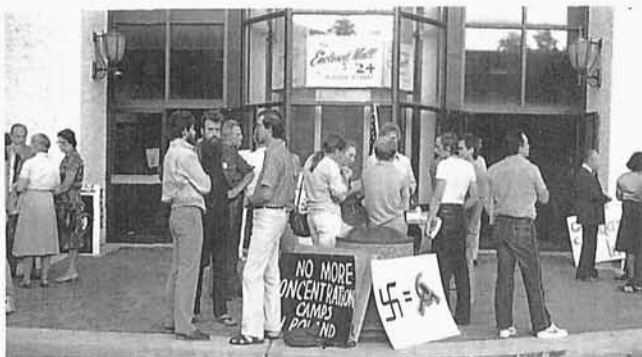
66. Demonstracja przed Konsulatem PRL, Autor stoi bokiem na pierwszym planie, Nowy Jork 1983 r.