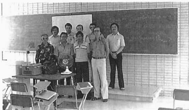
55. Autor ze swoimi meksykańskimi studentami, Ciudad Juárez, Meksyk 1980 r.