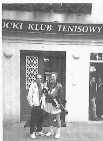
43. Autor z Wojtkiem Fibakiem , najlepszym polskim tenisistą w historii, Sopocki Klub Tenisowy 1998 r.