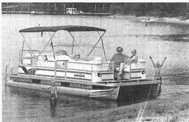
104. Ponton, kolejny „kłopot” (miły) Targowskich, Jezioro Michigan, Saugatuck 2000 r.