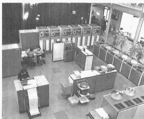
28. Komputer amerykański IBM 360/50, pierwszy tego typu zainstalowany w Polsce w ośrodku ZETO-ZEWAR, kierowanym przez Autora. Komputer ten zrewolucjonizował rozwój konstrukcji komputerów, został skopiowany w produkcji sowieckich maszyn RIAD. W PRL był produkowany pod nazwą RIAD 30.