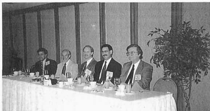
113. Międzynarodowa konferencja Information Resource Management Association , Autor pierwszy z prawej (wiceprezydent) w prezydium Konferencji, Boston 1998 r.