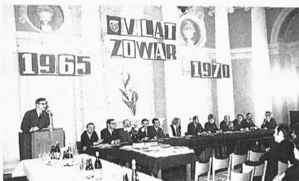
24. Autor przemawia na spotkaniu z okazji 5-lecia ośrodka obliczeniowego ZETO-ZOWAR w 1970 r. Ośrodek funkcjonuje nadal (2001 r.)