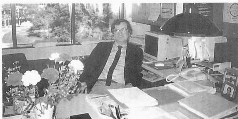
116. Gabinet Autora na Western Michigan University , po lewej bialo-czerwone goździki, lata 90.