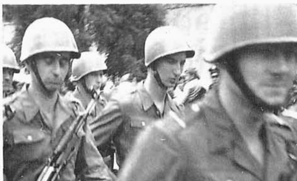
13. Autor (ppor. rezerwy, w środku) na obozie studenckim, wojskowym w Dęba Rozalin w 1961 r.