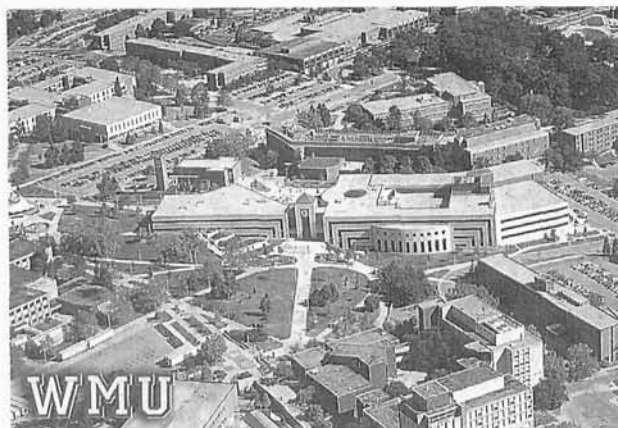
115. Miasteczko Western Michigan University , gdzie pracuje Autor, 2001 r.