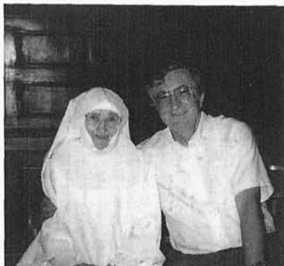
8. Autor z Siostrą Bernardą , która opiekowała się nim, 7-letnim dzieckiem, podczas Powstania Warszawskiego, Szymanów 2001 r.