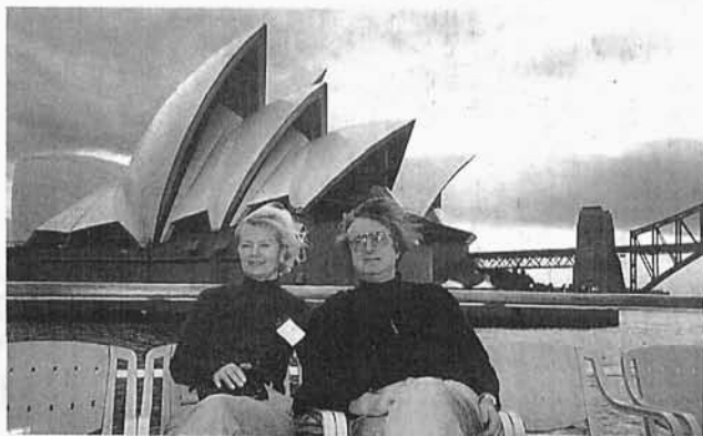
110. Autor z żoną w Sydney, 1995 r.