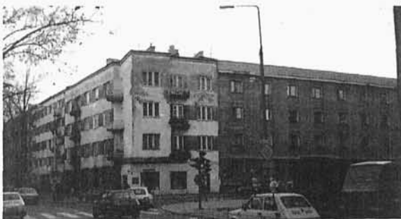
9. Dom przy ul. Kazimierzowskiej 55 (róg ul. Małasińskiej), gdzie mieszkał na I piętrze (narożnym) Autor podczas Powstania Warszawskiego, a w sąsiednim domu wyszedł spod trupów egzekucji. Po wojnie na miejscu tego domu wybudowano nowy, zdjęcie z 1995 r.