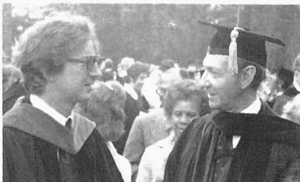
45. Kurt Waldheim , sekretarz Generalny ONZ, późniejszy prezydent Austrii, po otrzymaniu Doctor Honoris Causa mówi Autorowi, że jego żona pochodzi z Galicji, Hamilton College, Clinton w stanie Nowy Jork 1975 r.