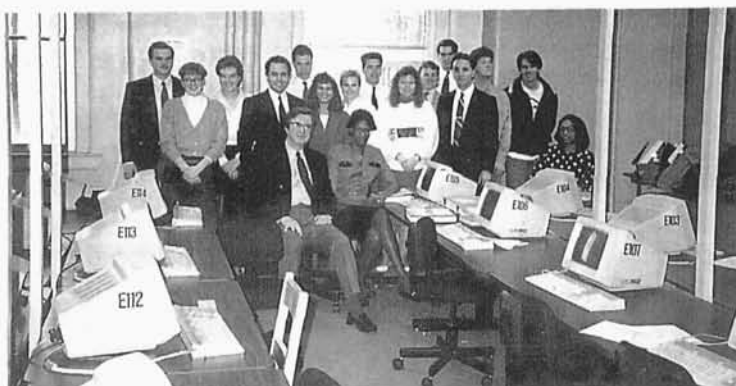
114. Autor ze swoimi studentami na Western Michigan University , Kalamazoo 1990 r.