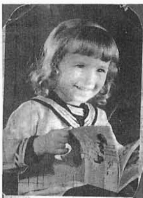
15. Autor na zdjęciu, które w Oświęcimiu uratowało życie jego Ojcu