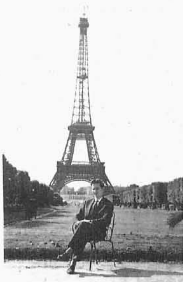
29. Autor na stażu informatycznym w firmie BULL w Paryżu w 1962 r.