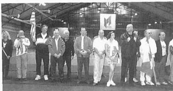
41. Turniej Tenisowy Polonii, Autor jest chorążym tenisistów ze Stanów Zjednoczonych, Sopot 1998 r.