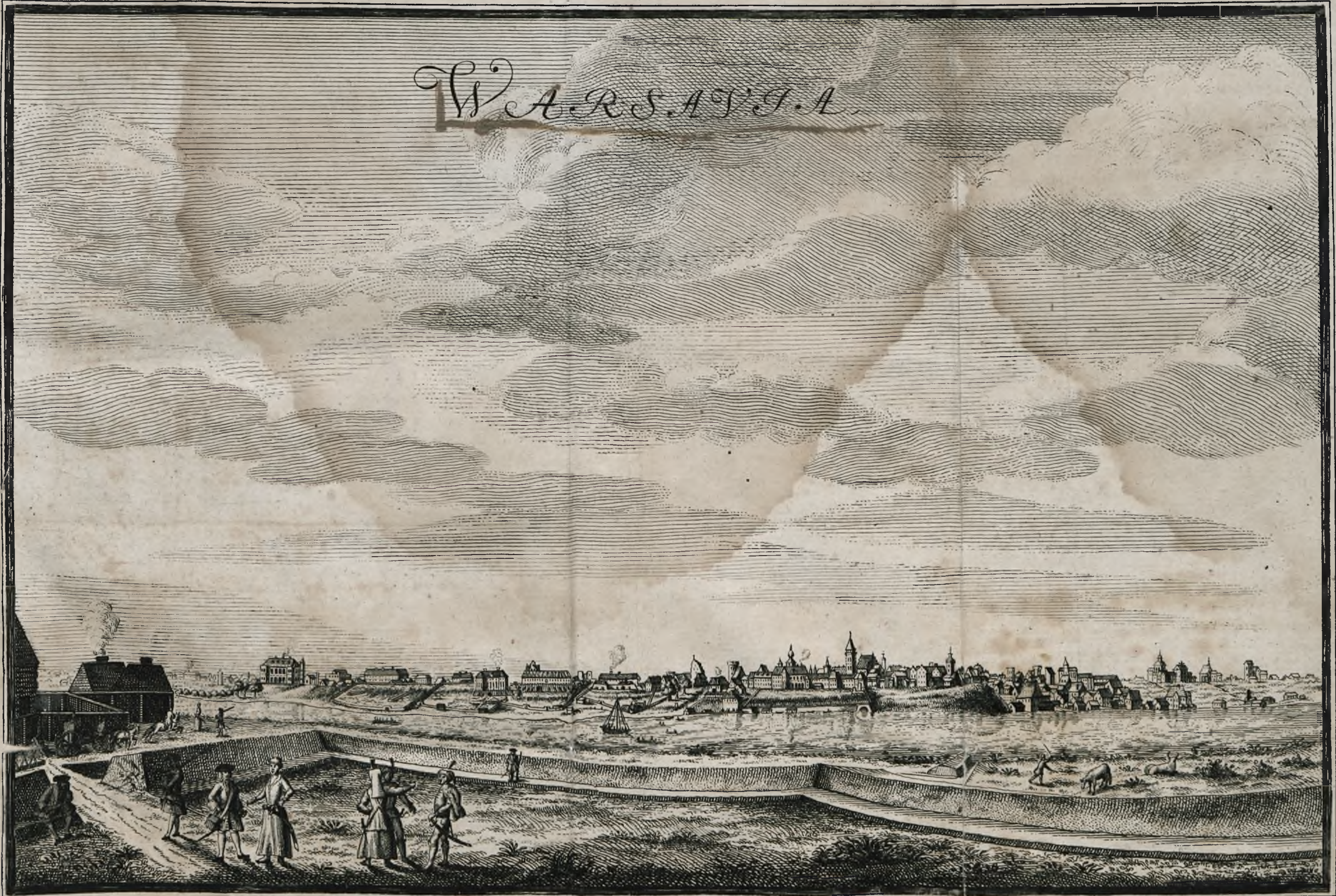
Nach dem Naturel gezeichnet, von C.F. Erndl. Ingen. Capit.