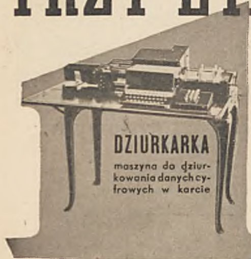
DZIURKARKA maszyna do dziurkowania danych cyfrowych w karcie