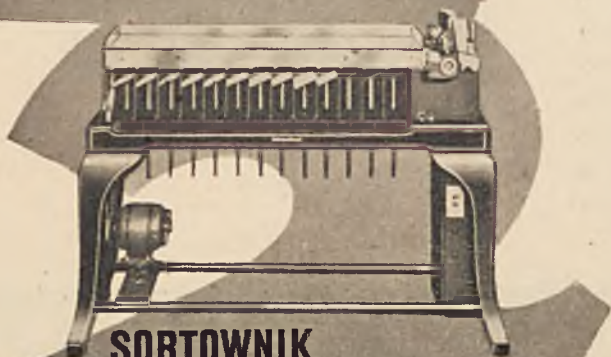
SORTOWNIK maszyna do sortowania kart według dowolnej klasyfikacji